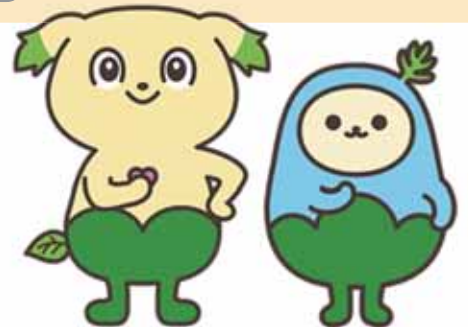
たもちい そよりん

まずは最寄りの森林組合までご相談ください。内容に応じて、ご希望に沿ったお見積もりをご案内いたします。